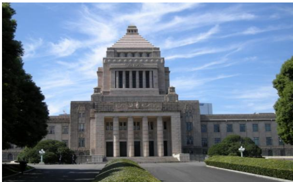
ສະພາແຫ່ງຊາດຍີ່ປຸ່ນ

ລັດຖະບານຈະເປີດປະຊຸມຄະນະລັດຖະມົນຕີອາທິດລະ 2 ຄັ້ງ ໃນວັນອັງຄານແລະວັນສຸກແຕ່ເນື້ອໃນການປະຊຸມນັ້ນຈະຖືກກຳນົດກ່ອນ 1 ມື້ ໃນກອງປະຊຸມຂອງຄະນະປະລັດກະຊວງໄວ້ແລ້ວ ດັ່ງນັ້ນເພື່ອທີ່ຈະຜັກດັນນະໂຍບາຍທີ່ວ່າ “ ຄວາມເປັນຜູ້ນຳທາງການເມືອງ “ ຈຶ່ງໄດ້ມີການພິຈະລະນາແນວທາງທີ່ຈະເສີມສ້າງຄວາມແຂງແຮງໃຫ້ກັບກົນໄກການເຮັດວຽກຂອງຄະນະລັດຖະມົນຕີ, ໂດຍສະເພາະແມ່ນກົນໄກການເຮັດວຽກຂອງທຳນຽມນາຍຍົກ ນອກຈາກນີ້ ຍັງເກີດເລື່ອງທີ່ວ່າ ຜູ້ທີ່ເປັນແກນນຳ ສໍລາດບັງລັດ (ຄໍລັບຊັ້ນ) ໃນກະຊວງການເງິນແລະກະຊວງສາທາລະນະສຸກແລະສະວັດດີການສັງຄົມ ເຮັດໃຫ້ມີສຽງວິພາກວິຈານຕໍ່ລະບົບແກ່ນນຳຢ່າງຮ້າຍແຮງຈາກປະຊາຊົນ ຈຶ່ງໄດ້ມີຄວາມພະຍາຍາມທີ່ຈະຜັກດັນການປະຕິຮູບລະບົບການບໍລິຫານ ການຜ່ອນຜັນລະບຽບກົດເກນ ຕະລອດຈົນລົບລ້າງລະບົບການປົກຄອງໂດຍກຸ່ມແກ່ນນຳ ແລະເຮັດໃຫ້ເກີດລະບົບການປົກຄອງໂດຍການນຳຂອງນັກການເມືອງ ອັນນີ້ກໍ່ໄດ້ກາຍເປັນຫົວຂໍ້ນະໂຍບາຍຂອງແຕ່ລະພັກການເມືອງຢູ່ໃນເວລານີ້.